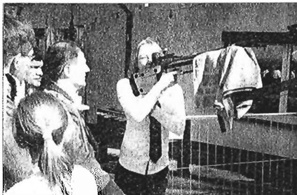
Beim Schießen auf dem Hochstand.

Die Schützenbruderschaft Sankt Sebastianus Roisdorf führte in diesem Jahr den Bezirksjungschützentag auf dem Schießstand in der Essener Straße durch. Bei wunderschönem Wetter hatte man einen herrlichen Überblick aus der Höhe über die Frühlingslandschaft im Vorgebirge. Auf dem Luftgewehr-Schießstand wurden die Bezirkswettbewerbe ausgetragen. Auf dem ganzen Gelände des Schießstandes fand ein attraktives Rahmenprogramm statt, das den Jungschützen die Zeit nicht langweilig werden ließ, während sie darauf warteten, dass sie zum nächsten Wettbewerb wieder an der Reihe waren. Dabei wurde auch mit dem Luftgewehr ein Schießen auf dem Hochstand veranstaltet, dort wo auch das Königsschießen ausgetragen wird. Fünf Schützen pro Mannschaft konnten auf die Bestecke schießen, die aber nicht abgeschossen wurden. Es wurden Löcher an den Bestecken angebracht und mit Zielscheiben unterfüttert. Dann wurden die Treffer auf den Zielscheiben addiert. Eine weitere Attraktion war auch ein Turnier am acht-