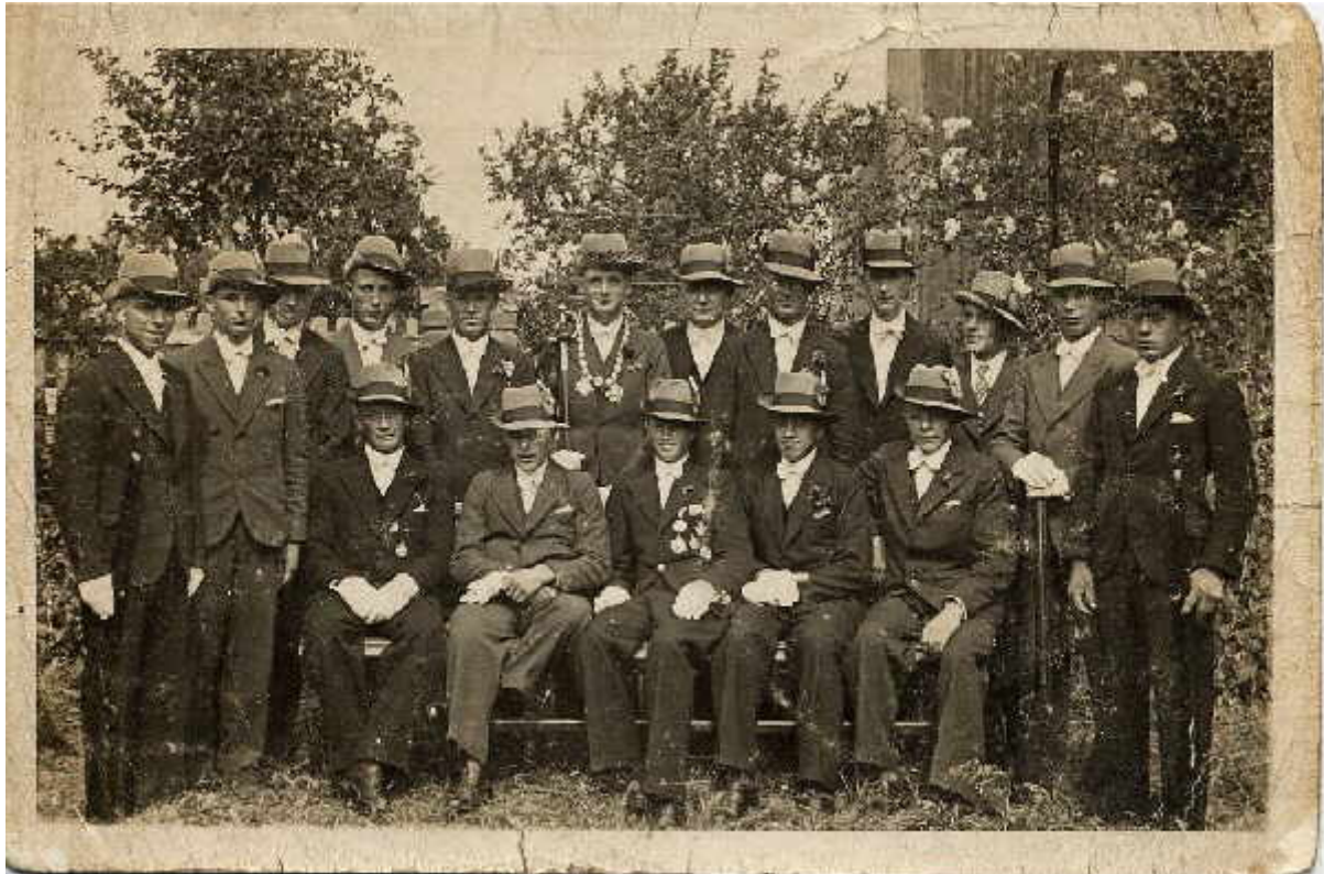
Jungschützen aus dem Jahr 1935. Junge Schützenbrüder in einer so genannten Probezeit vor ihrer endgültigen Aufnahme in die Bruderschaft. Als äußeres Zeichen wurde lediglich der Schützenhut und die weiße Fliege getragen. Die grüne Uniform erst gab es erst nach Ablauf der Probezeit.

Zu Beginn der dreißiger Jahre meldete die Schützenbruderschaft ihre Mitglieder bei der kirchlichen Erzbruderschaft vom heiligen Sebastian an und wurde damit kirchlicher Verein. Dies war in jener Zeit die einzige Möglichkeit um als eigenständige Vereinigung bestehen zu dürfen.