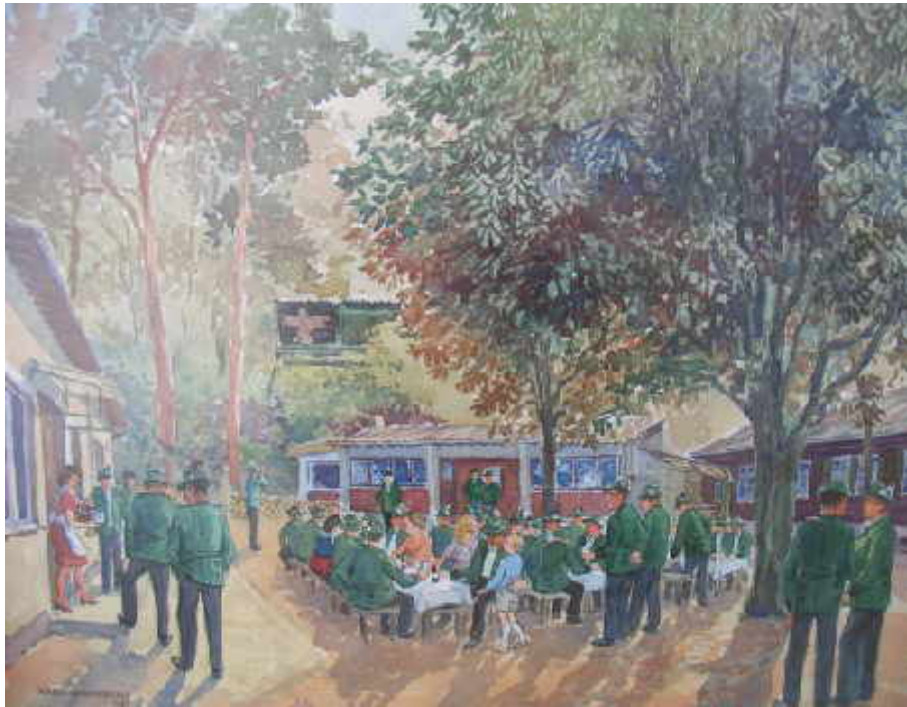
Abbildung eines Schützenfestes auf dem Schützenplatz.