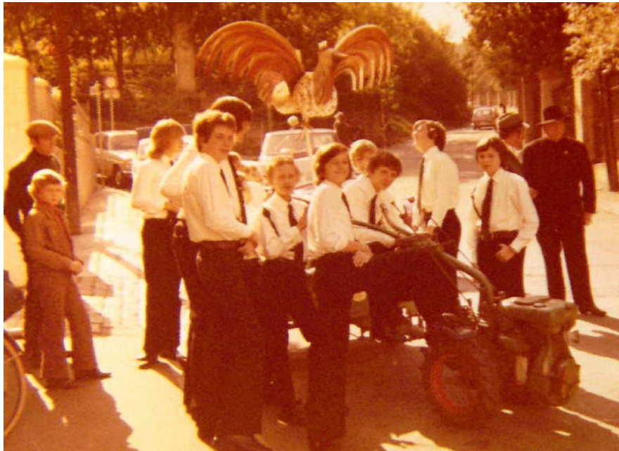
Jungschützen mit dem Königsvogel auf dem Weg zum Schützenplatz ca. September 1969

Das vorhandene Grundstück reichte aber für die stetig ansteigenden schießsportlichen Aktivitäten nicht mehr aus. So erwarb die Schützenbruderschaft ein weiteres Grundstück hinzu und erhielt grünes Licht für die Errichtung von drei Kleinkaliberständen mit 50-m-Bahnen. Ergänzt wurde diese Anlage durch sechs Pistolenstände von je 25 Metern. Nach Fertigstellung dieser Bauprojekte verfügte die Bruderschaft über eine moderne, allen Anforderungen gerecht werdende Schießanlage.